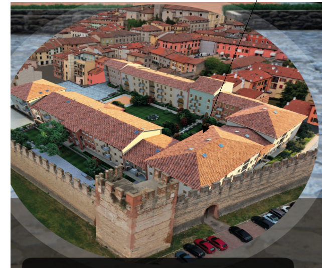
Render progetto Generale